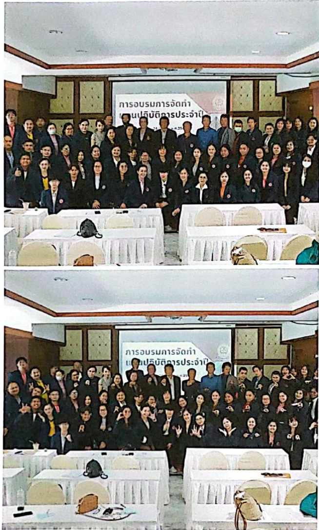
ผู้เข้าอบรมถ่ายภาพร่วมกัน