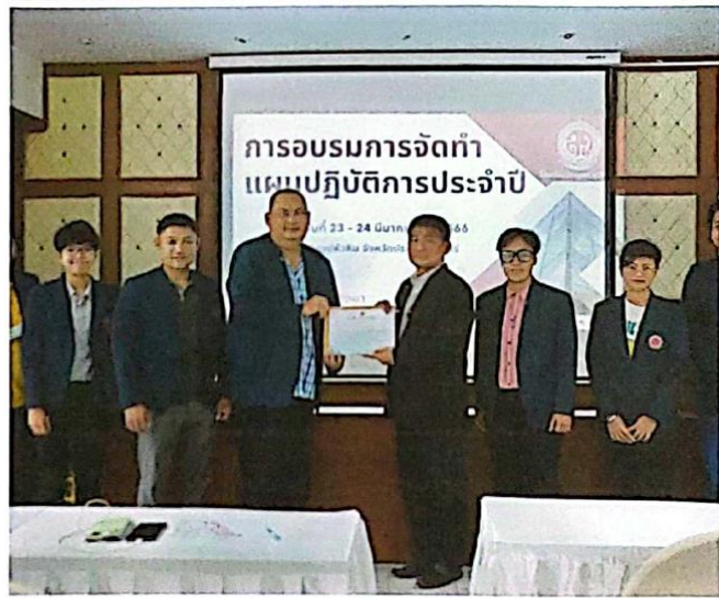
ผู้อำนวยการโรงเรียนมอบเกียรติบัตรให้แก่ ผู้เข้าร่วมอบรม