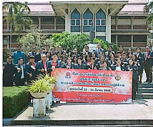
คณะผู้บริหาร คณะครู และบุคลากรทางการศึกษา ทั้งสองโรงเรียนถ่ายภาพร่วมกัน