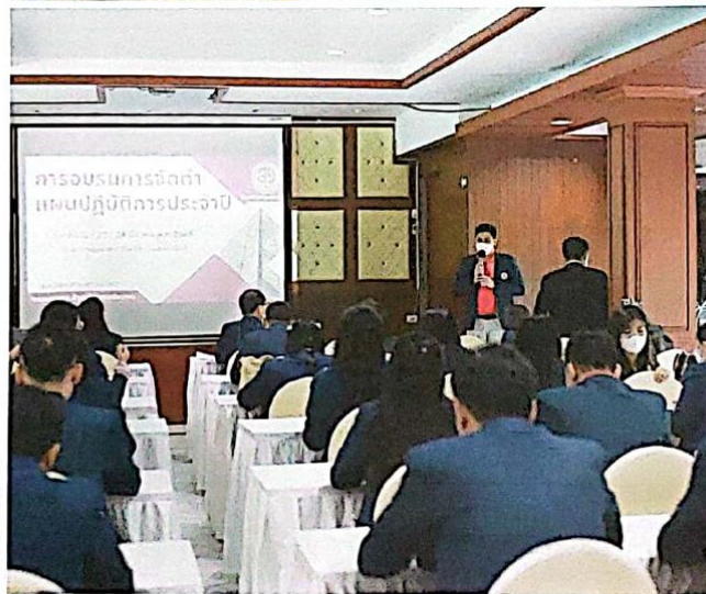
การอบรมการจัดทำโครงการ/กิจกรรม ตามแผน ปฏิบัติการประจำปี