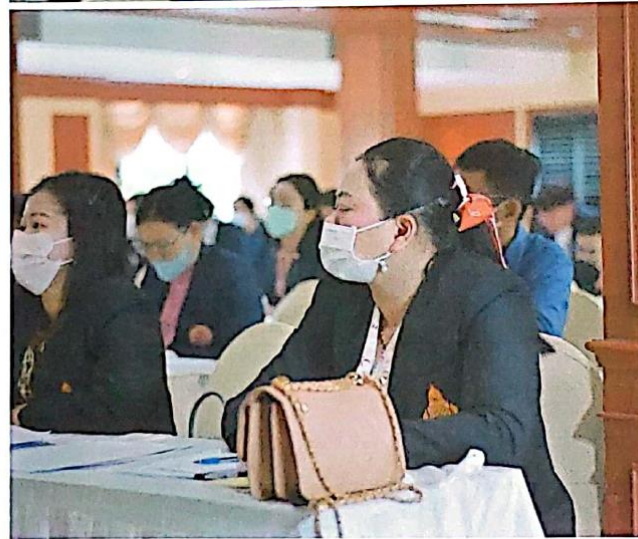
การอบรมการจัดทำโครงการ/กิจกรรม ตามแผน ปฏิบัติการประจำปี